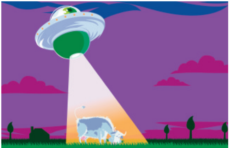
Illustration : Benwar Home Design